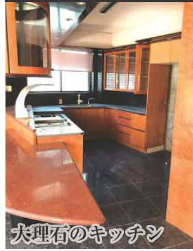
大理石のキッチン